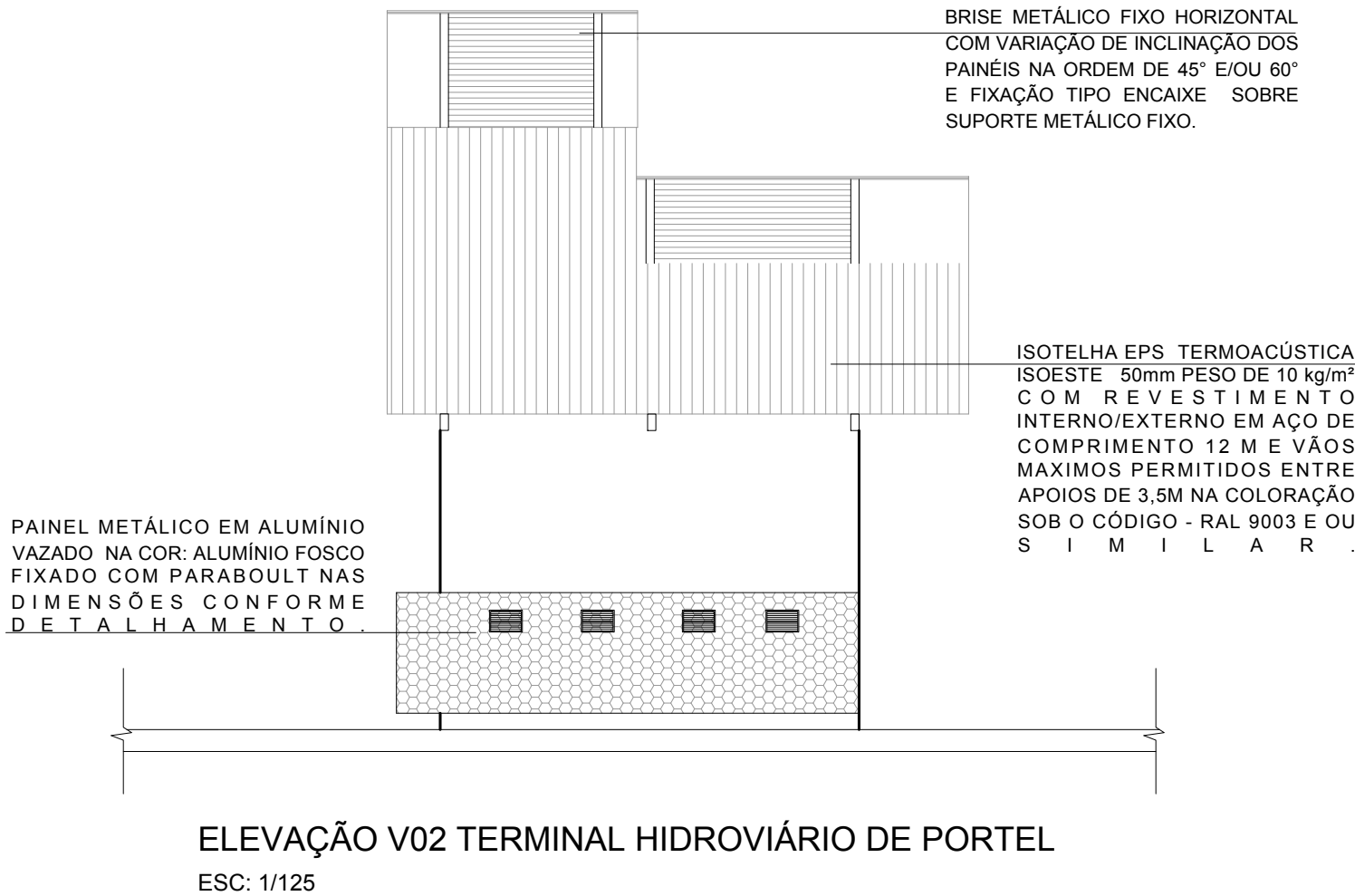
ELEVAÇÃO V02 TERMINAL HIDROVIÁRIO DE PORTEL ESC: 1/125