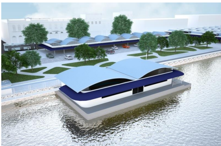
Imagem 1 –Terminal Hidroviário do Ver o Peso – Cooperação CPH - SEMOB

Termo de Cooperação com a Secretaria Estadual de Turismo – SETUR para elaboração do Projeto Naval para o Terminal Hidroviário de Ponta de Pedras no Marajó.