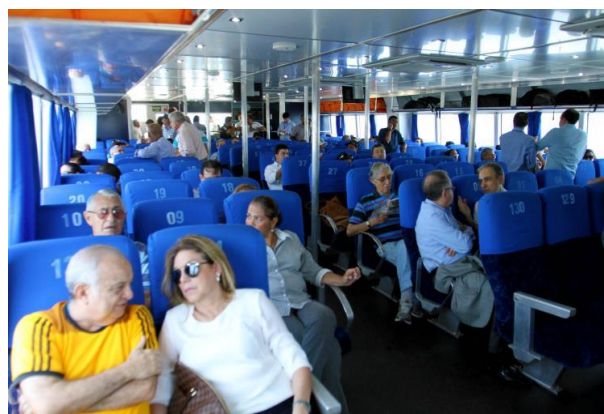
Fotos 1 e 2 – Catamarã do Expresso Hidroviário Tapaiós com destino a Soure