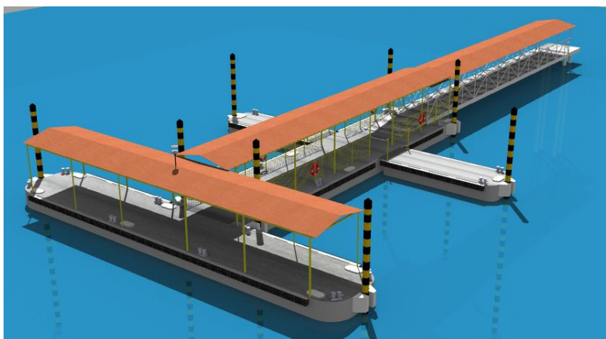
Imagem 2 –Estrutura Naval Icoaraci – Cooperação CPH - SEMOB